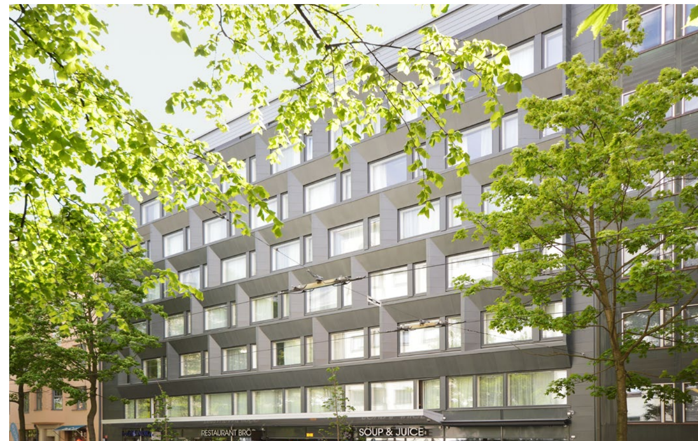
Uusi julkisivu (yllä) toi hotellin ilmeeseen monimuotoisuutta aiempaan (alla) verrattuna.

V anhan julkisivun tilalle asennettiin uudet kevytelementit, joiden ulkopuolen muodostavat voimakkaasti profiloitunut metallikasetit. Kasettien pinnoitus on valmiiksi patinoitua titaanisinkkipeltiä. Vastaavaa materiaalia on käytetty mm. Kiasmassa. Julkisivun ilmeeseen ja sommitteluun vaikutti hotellin vasemmalla puolella oleva 1911 valmistunut jugendtaló Lehtolinná, ja oikealla puolella oleva kuparipintainen vuodelta 1952 peráisin oleva toimistorakennus.